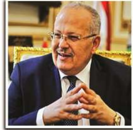
أ.د/ محمد عثمان الخشت رئيس جامعة القاهرة